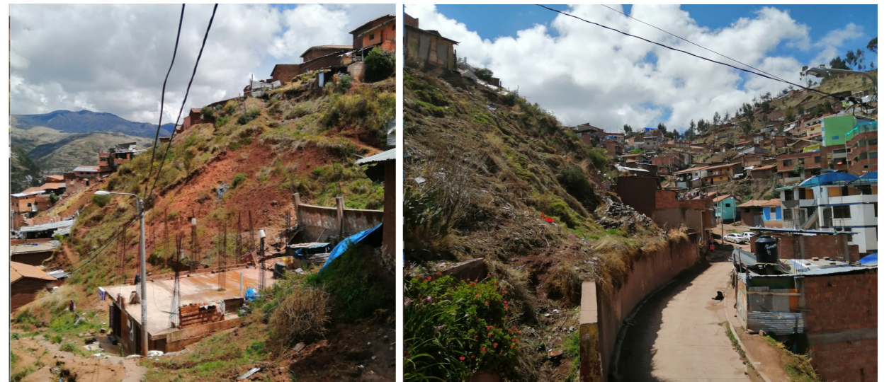
VIVIENDAS UBICADAS EN LADERAS MUY EMPINADAS EXPUESTAS A PELIGRO POR DESLIZAMIENTO